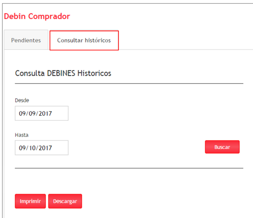
Imagen N° 6