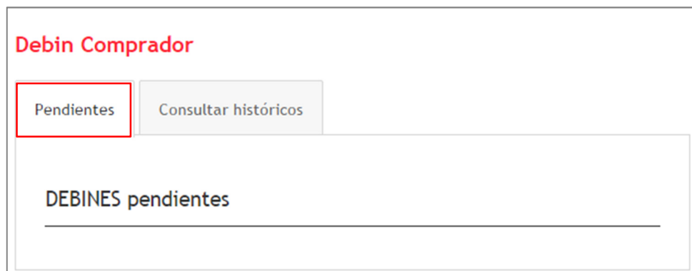
Imagen N° 5